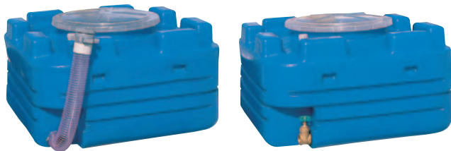
■1000ℓ<透明フタ付・ホース付>