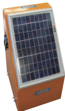
ソーラービビット (ソーラー電牧器・バッテリーケース)