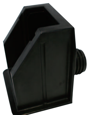
落水ボックス(水田水位調整機能付排水枡)