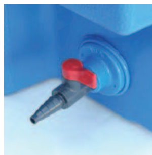
⑤ラブコック 流量調整ができるコックです。サイズは15Aです。