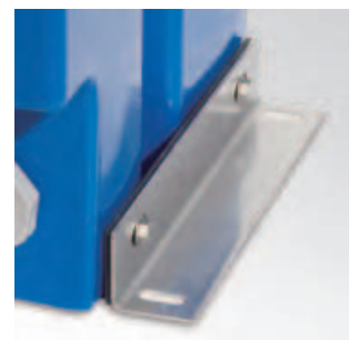
⑥アンカー止め金具 本体を確実に固定します。本体側面のインサートナットに取り付けます。