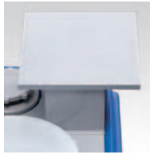
①ポンプ架台 ポンプ取付用の穴あけはポンプに合わせ、現合で行ってください。