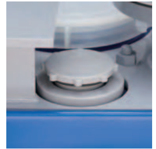
②ポンプサクシヨ口 ここより液を吸い出します。このサクシヨ口からタンク底20 ミリのところまでは内部配管が下がっています。