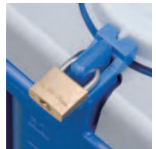
④鍵 フタを確実に固定します。取り扱いが必要な液体をご使用の際には、装着をお勧めします。写真は50ℓ,100ℓタイプの鍵付です。200~1000ℓはロック棒式になります。